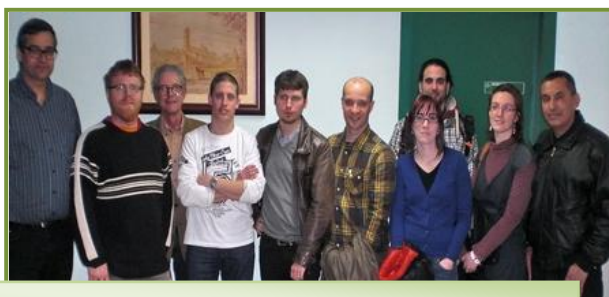
Imatge d'arxiu de la darrera Jornada de Benvinguda

Els nous col·legiats podran visitar les nostres instal·lacions (c/ enamorats, 62-64 baixos, Barcelona), parlar amb la Junta i amb companys que treballen en diversos àmbits i on s'explicarà el funcionament del Col·legi i l'exercici de la professió.