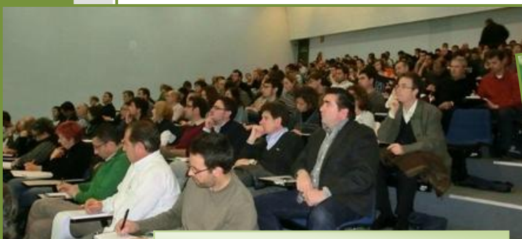
Unes 200 persones van assistir a l'acte

Per a més informació i per accedir a les ponències cliqueu aquí .