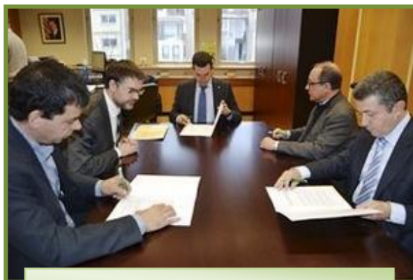
Fotografia premsa durant la signatura.

L'objecte del conveni és la col·laboració per dotar de contingut, revisar i actualitzar l'apartat anomenat "Suport a la Indústria Agroalimentària" a la web Ruralcat. ( www.ruralcat.net ). Aquesta eina es crea per recolzar i fomentar l'activitat industrial agroalimentària catalana, facilitant informació, assessorant el sector i donant resposta a les consultes sorgides.