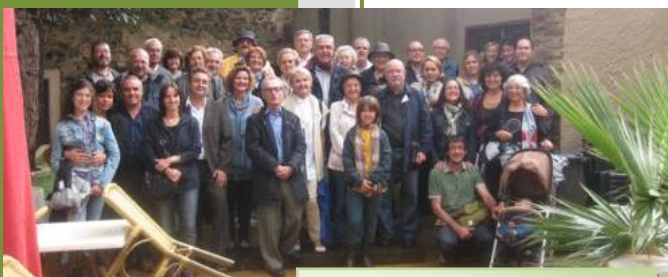
Assistents a Sant Galderic

En primer lloc es va realitzar una visita al Castell-Monestir d'Escornalbou, al municipi de Riudecanyes (Baix Camp), i posteriorment es va dinar al Restaurant Reiet del Camp, de Vilanova d'Escornalbou.