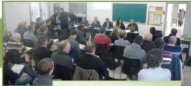
Imatge de la Jornada a Amposta

La inauguració va anar a càrrec del Director dels Serveis Territorials del DAAM, el Director General de Desenvolupament Rural del DAAM i la Directora de l'ICAEN. Va ser una jornada amb molta participació, van assistir prop d'unes 50 persones.